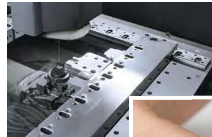
Schneidstempel für einen 0,3-mm-Schneidspalt sind auf den Mitsubishi Electric Erodiersystemen kein Problem.